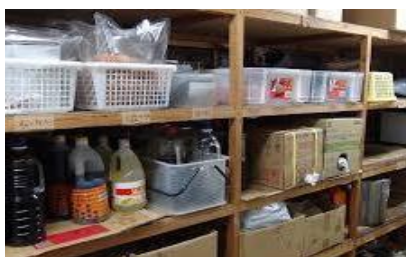
➤ 備品消耗品の管理